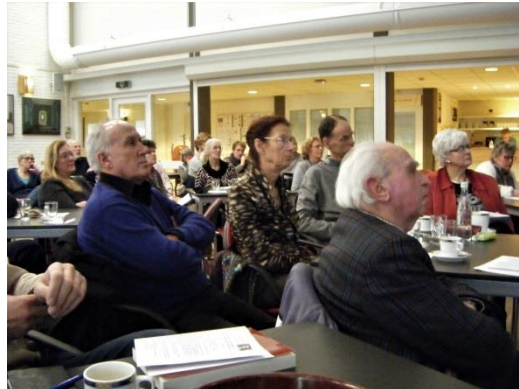
De mensen in de zaal denken hier zichtbaar over na.