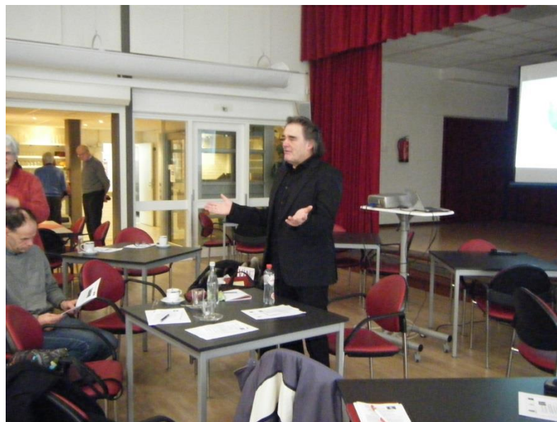
Flameling beeldt het uit

In de huidige maatschappij vind je ze terug in de economie (met gesloten armen, naar jezelf toe) en in de ethiek (met open armen, loslaten van het ik, open staan voor de ander).