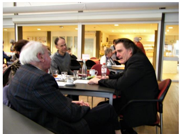
Tijdens de pauze wordt daar volop over gediscussieerd