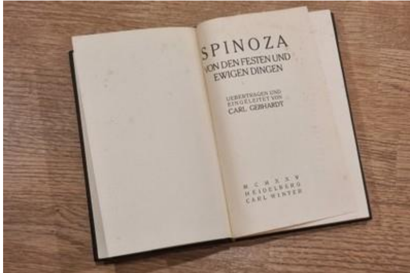
De titelpagina van Spinoza , Von den festen und ewigen Dingen .

methodiek. Deze inleiding heb ik in het Nederlands vertaald. Een poging om ook het hoofdwerk in het Nederlands te laten vertalen heb ik opgegeven en in plaats daarvan heb ik deze kern- of hoofdgedachte geschreven.