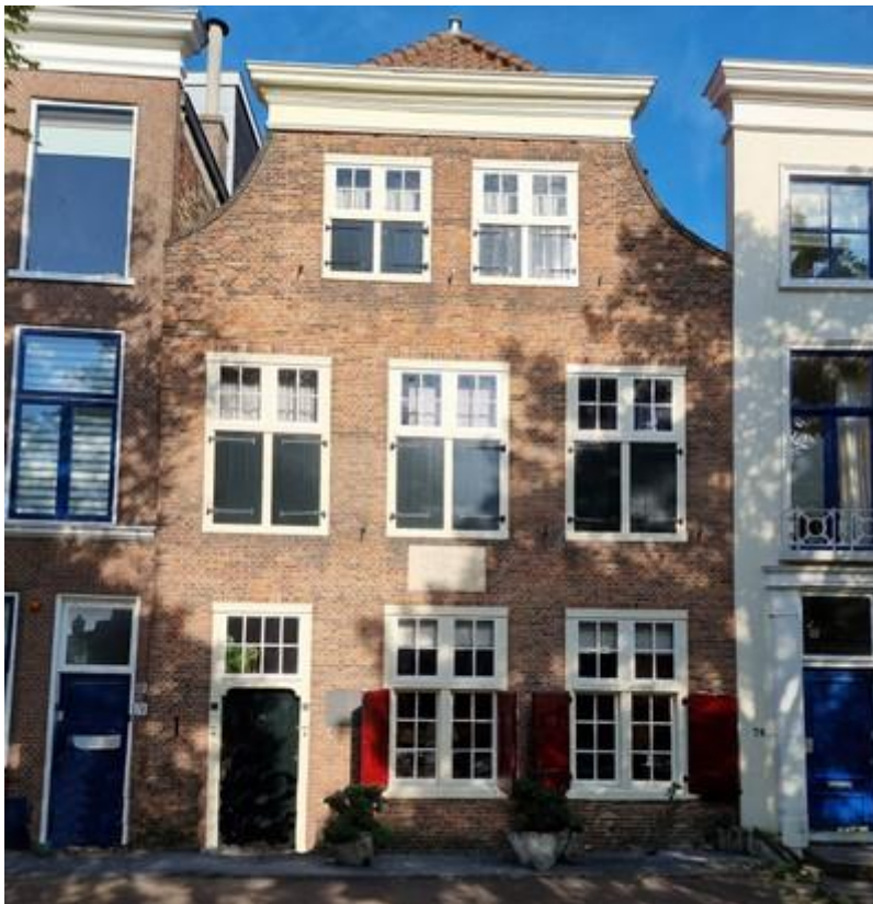
Domus Spinozana Den Haag