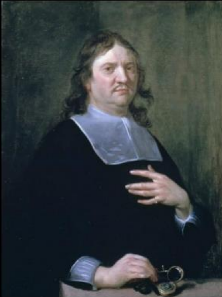
Henry Oldenburg, secretary of The Royal Society in 1662.

statieportret met rechterhand rustend op chronometer